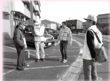
▲認知症行方不明者搜索模擬訓練