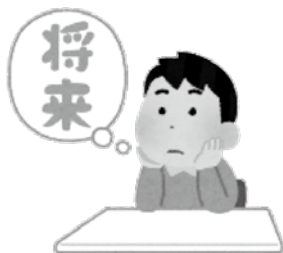
大府市人口の将来推計

大府市の高齢化率は、21.4%と全国平均の28.6%に比べると低いですが、5人に1人が高齢者となり、超高齢社会に突入しています。ひとり暮らし高齢者や、何らかの支援が必要な要支援・要介護認定者も増加しており、今後は公的サービスだけで対応することが難しくなってきます。また、地域にはさまざまな理由で生活に課題を抱えている人がおり、社会的孤立に陥る人が増えていくことが想定されます。