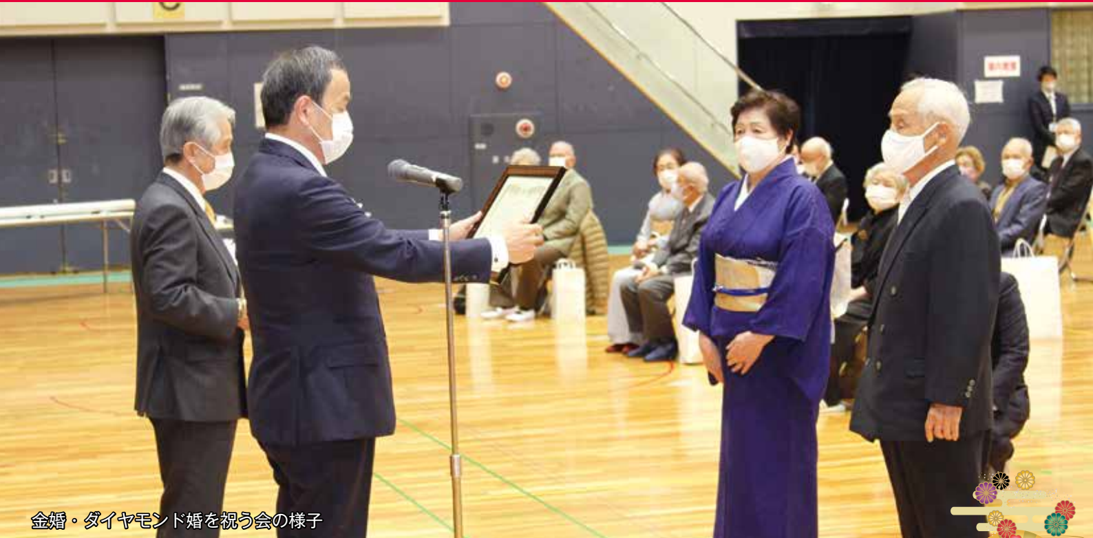
金婚・ダイヤモンド婚を祝う会の様子

あけましておめでとうございます。皆様のご健勝を心からお慶び申し上げます。また、旧年中は本会にご支援とご協力を賜り厚くお礼申し上げます。市民の皆様から多くの会費や共同募金、ご寄付をいただき、福祉のまちづくりを推進することができました。心より感謝申し上げます。