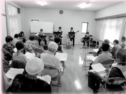
▲ふれあいサロン活動