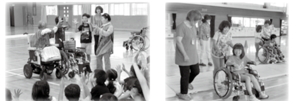
福祉実践教室の様子

社会福祉協議会では、子どもたちがふくしを学ぶ機会として、学校や協力者の皆さんと福祉実践教室に取り組んでいます。興味・関心があれば、ぜひご連絡ください!