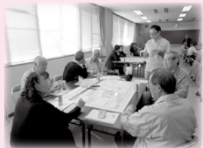
▲地域福祉行動計画の策定