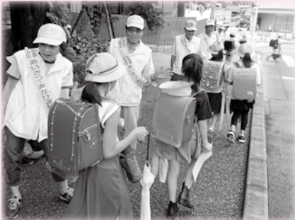
▲あいさつ・声かけ運動

【支えあいの仕組みづくり】地域支えあいマップづくり、黄色いリボン事業、あったか見守り票など