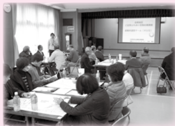
▲ご近所ふれあい活動応援講座