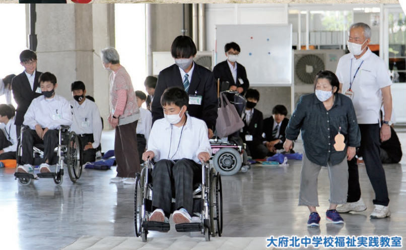
大府北中学校福祉実践教室