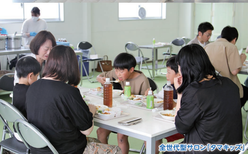
全世代型サロン「タマキッズ」