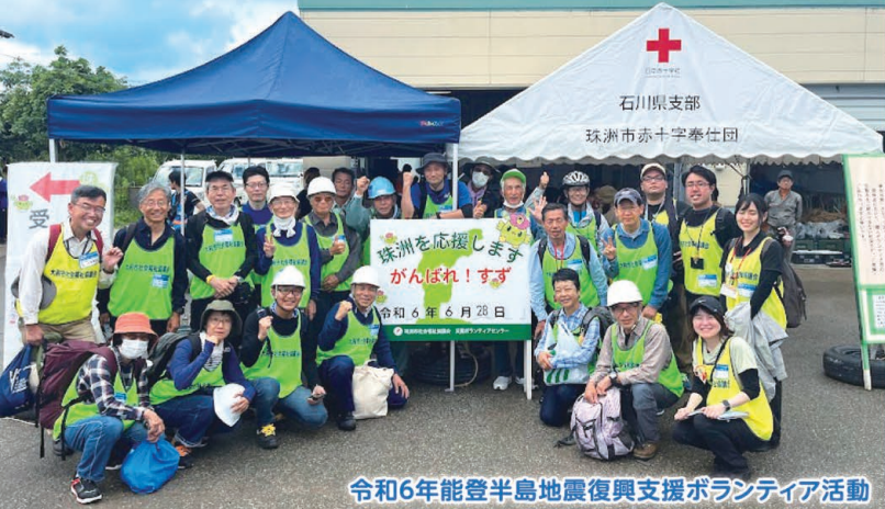
令和6年能登半島地震復興支援ボランティア活動