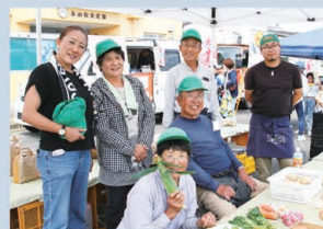
生産者のみなさん