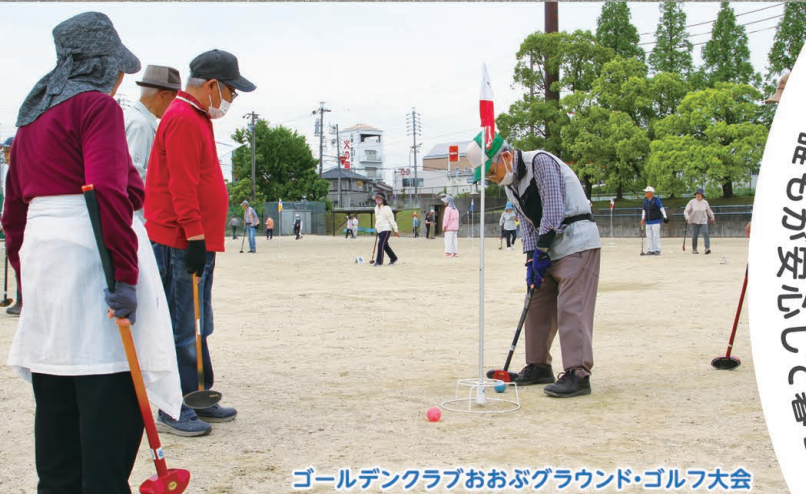
ゴールデンクラブおおぶグラウンド・ゴルフ大会